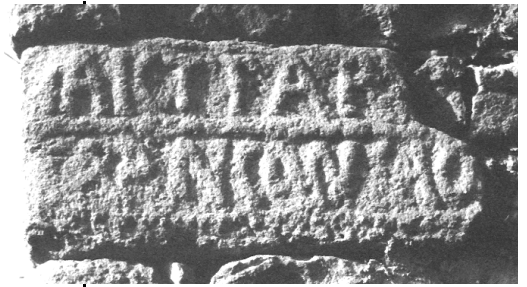
Inscription relevée sur un mur d'Arcens.

Le centre éponyme de cette viguerie, située à l'évidence sur les confins vivaro-vellaves aux contacts des Boutières et du haut plateau, n'est pas identifié avec certitude. Deux lieux peu distants l'un de l'autre, paraissent en-